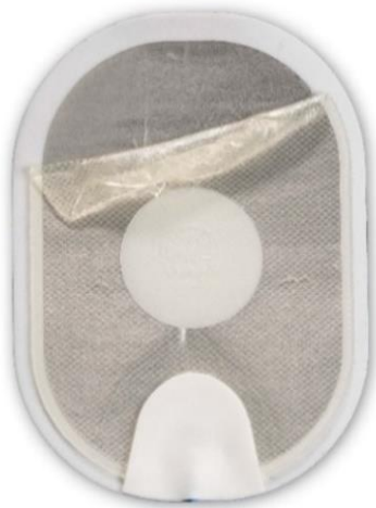
Figur 1: Separeret gel, der har foldet sig sammen, da elektroden blev trukket af.

Det er også muligt, at gelen kan adskille sig næsten helt fra skum-/tinbagbeklædningen, når bagsiden trækkes af (se figur 3 ). På grund af en lille geloverfladekontakt med huden kan der opstå elektrisk buedannelse, når der gives stød, som medfører forbrændinger af patientens hud, eller AED'en kan være ude af stand til at levere stød gennem elektroderne. Der vil opstå en forsinkelse i behandlingen, mens brugeren installerer en ekstra elektrodekassette (hvis tilgængelig) eller udfører HLR, mens der ventes på, at der ankommer personale fra akutberedskabet. Til sammenligning viser figur 4 en normal elektrode. Uanset elektrodens tilstand skal du følge talemeddelelserne, da AED'en vil føre dig gennem de nødvendige handlinger.