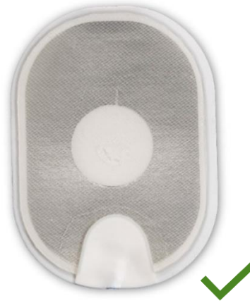
Figur 4: Normal elektrode.